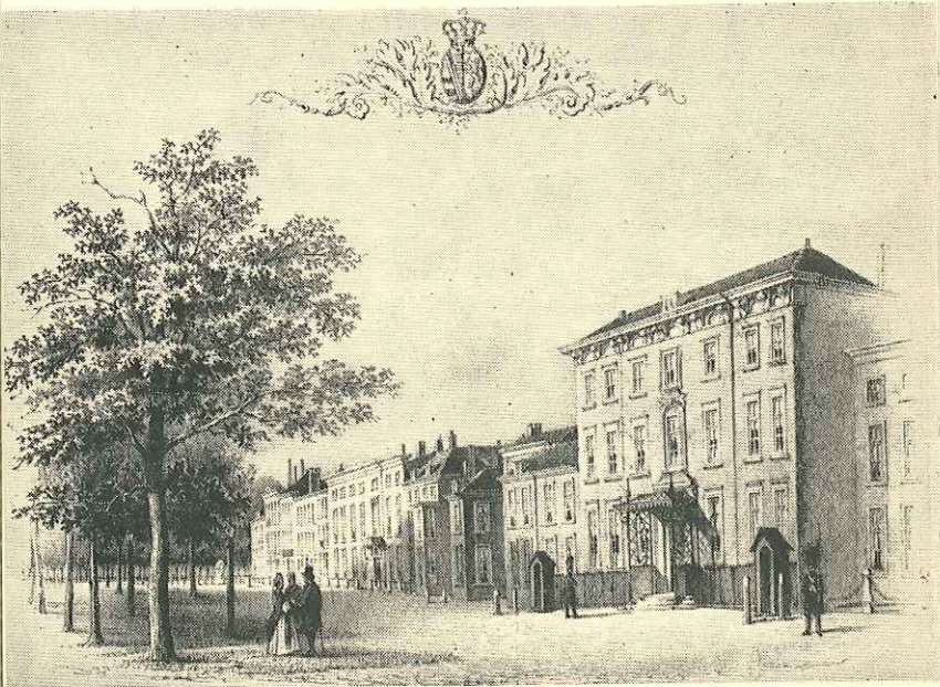
Het paleis van H.K.H. Prinses Sophie, Erfgrootertogin van Saxon Weimar-Eisenach