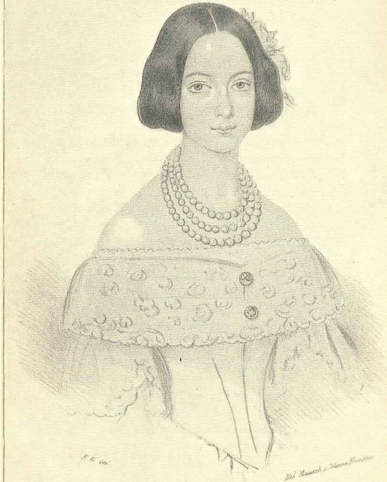
H.K.H. Prinses Sophie