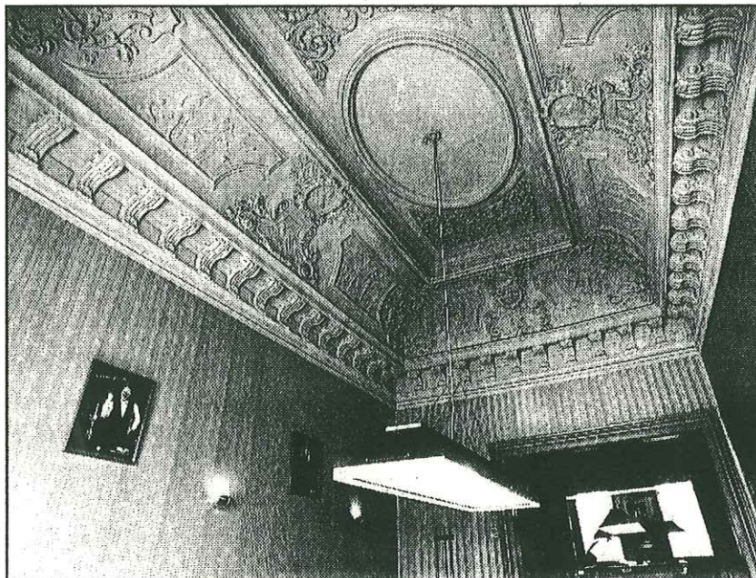
Snookersociëteit De Residentie.

hebben, volgens Ton Meurs, in de jaren veertig behoorlijk lopen roven. Ze hebben de kroonluchters, lambrizeringen, trappen en zelfs de sponningen onder hun arm meegenomen. „Het huis schijnt in die tijd gebruikt te zijn voor de meest fantastische orgieën”, weet hij.