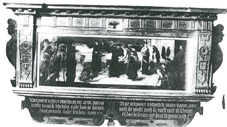
Afb. 2. Uitdeling door de Heilige Geestmeesters. Schilderij in het Heilige Geesthofje. c. 1580/90.