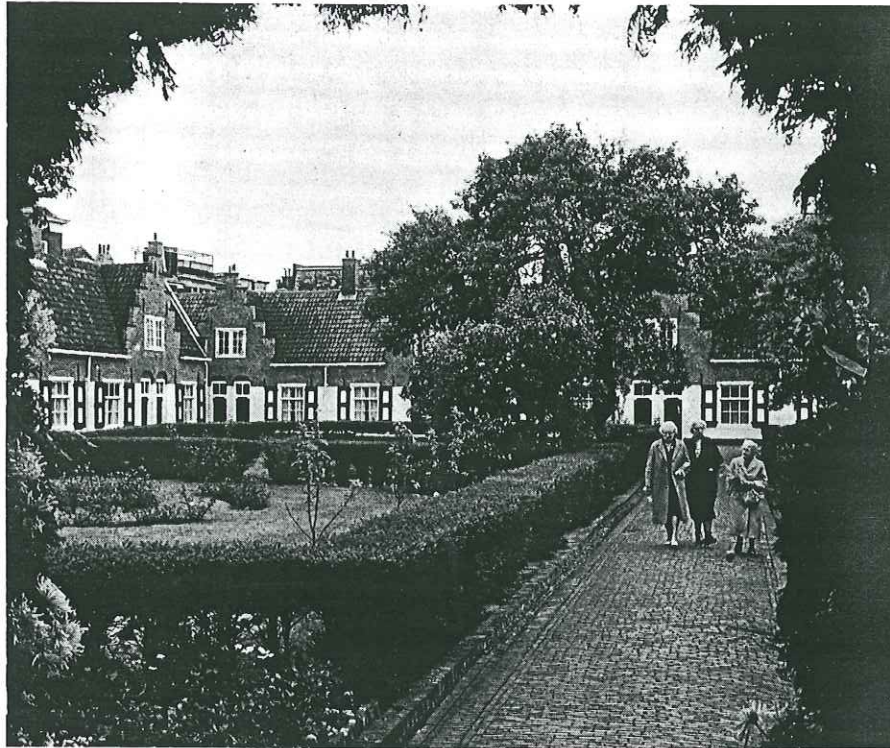
Afb. 4. Het Heilige Geesthofje aan de Paviljoensgracht. Foto Meyer, 1966 uit de verzameling van het Gemeentearchief.

Het Heilige Geesthuis werd gebouwd op een perceel weiland langs de nieuw gemaakte weg naar de Groenmarkt, de nieuwe Groenmarkt wel te verstaan, die aangelegd was op de grond van het in 1584 afgebrande Ste Elisabethsklooster, de tegenwoordige Grote Markt dus. Over de bouw van het Hofje is in het archief van de Heilige Geest zeer weinig te vinden. Bewaard gebleven is een kostenberekening van het metselwerk. 17