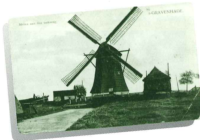
Brand 28 juli 1984