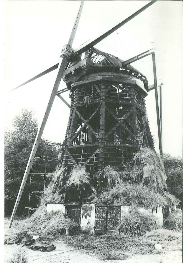
Geraamte molen na de brand

De Laakmolen viel in de zomer van 1984 ten prooi aan brandstichting.