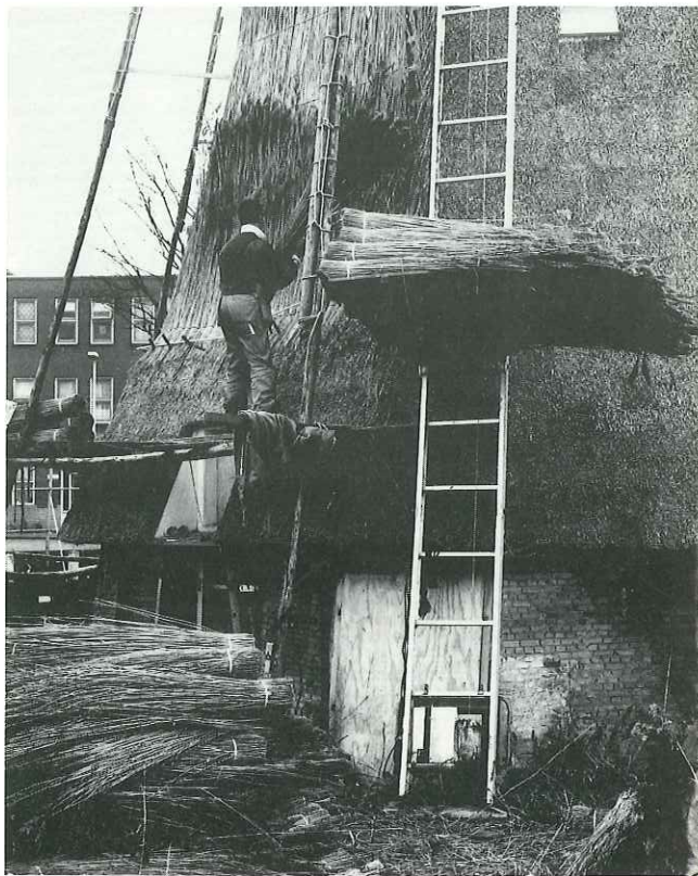
Het gerestaureerde achtkant op de herbouwde voet Het rietdeken