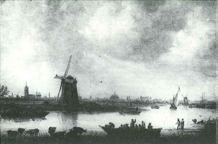
Schilderij van J. v. Goyen (1652)

De Laakmolen is een achtkante rietgedekte poldermolen, een grondzeiler van het type "Hollandse Molen".