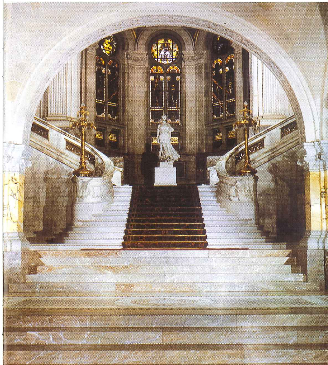
Eretrap / Le grand escalier / Grand staircase / Ehrentreppe

Op 28 augustus 1913 vond de plechtige opening plaats in aanwezigheid van o.a. Koningin Wilhelmina en Andrew Carnegie.