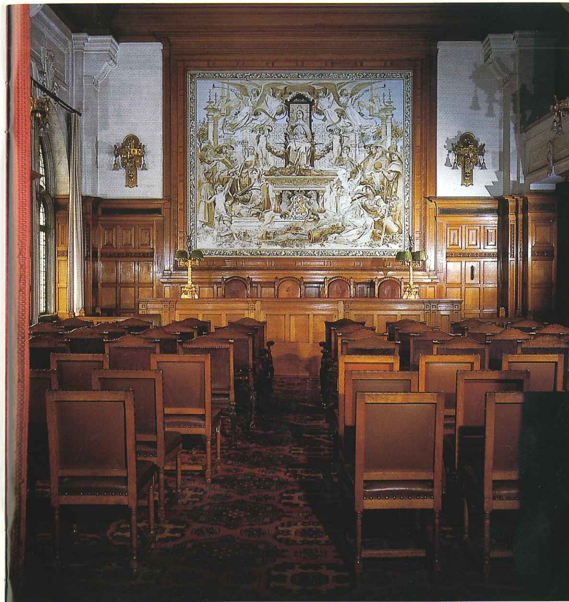
Kleine Rechtszaal / Petite Salle de Justice / Small Hall of Justice / Kleiner Gerichtssaal

Een uitgebreide bibliotheek op het gebied van het internationale recht en het recht van de verschillende landen staat aan de beide in het Vredespaleis gevestigde Hoven ten dienste. Een van de motieven van Carnegie voor de schenking van het Vredespaleis was dat deze bibliotheek erin zou worden opgenomen. Zij wordt, evenals het gehele paleis, beheerd door het bestuur der Carnegie Stichting en is dus geen onderdeel van de Verenigde Naties, zoals somtijds ten onrechte wordt gemeend. Oorspronkelijk was de bibliotheek met het boekenmagazijn ondergebracht in het paleis zelf. Toen echter de opnemings van het Permanente Hof van Internationale Justitie, na de Eerste Wereldoorlog, in het Vredespaleis een uitbreiding van het paleis noodzakelijk maakte, is een oplossing gevonden door het boekenmagazijn te verplaatsen naar een nieuw gebouw dat van de leeszaal uit door een overdekte brug met het hoofdgebouw verbonden is. De boekenschat der bibliotheek omvat internationaal publiek- en privaatrecht, vergelijkend recht en het recht en de jurisprudentie van alle landen ter wereld. Bovendien internationale politieke en diplomatieke geschiedenis en vredesbeweging. Als een bijzondere verzameling verdient vermelding de collectie Grotiana, d.w.z. de werken van de Nederlander Hugo de Groot, een van de beroemde grondleggers van de wetenschap van het volkenrecht. De bibliotheek bezit verder een aantal handschriften, waaronder brieven van Hugo de Groot.