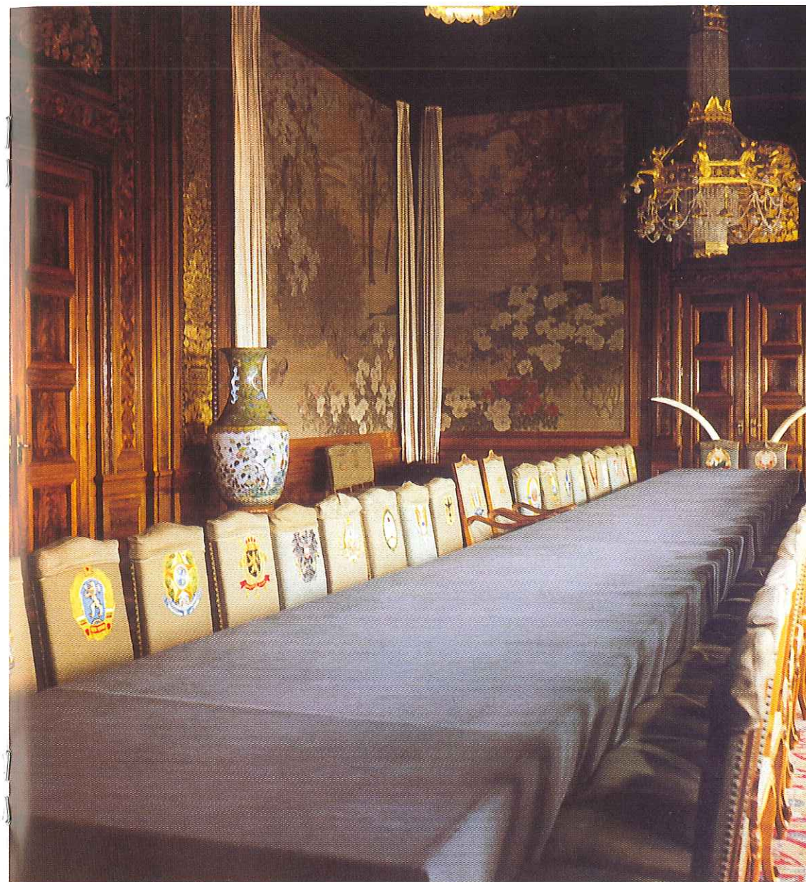
Japanse zaal / La salle japonaise / Japanese room / Japanischer Saal

On voit ainsi l'importance du Palais de la Paix dans le domaine de la justice internationale, de l'arbitrage international et du droit international. Le sens des efforts qui y sont déployés pour réaliser dans le monde un idéal de paix se résume dans cette inscription que l'on peut lire dans le hall d'entrée: Sol justitiae illustra nos – Soleil de la justice, éclaire-nous!