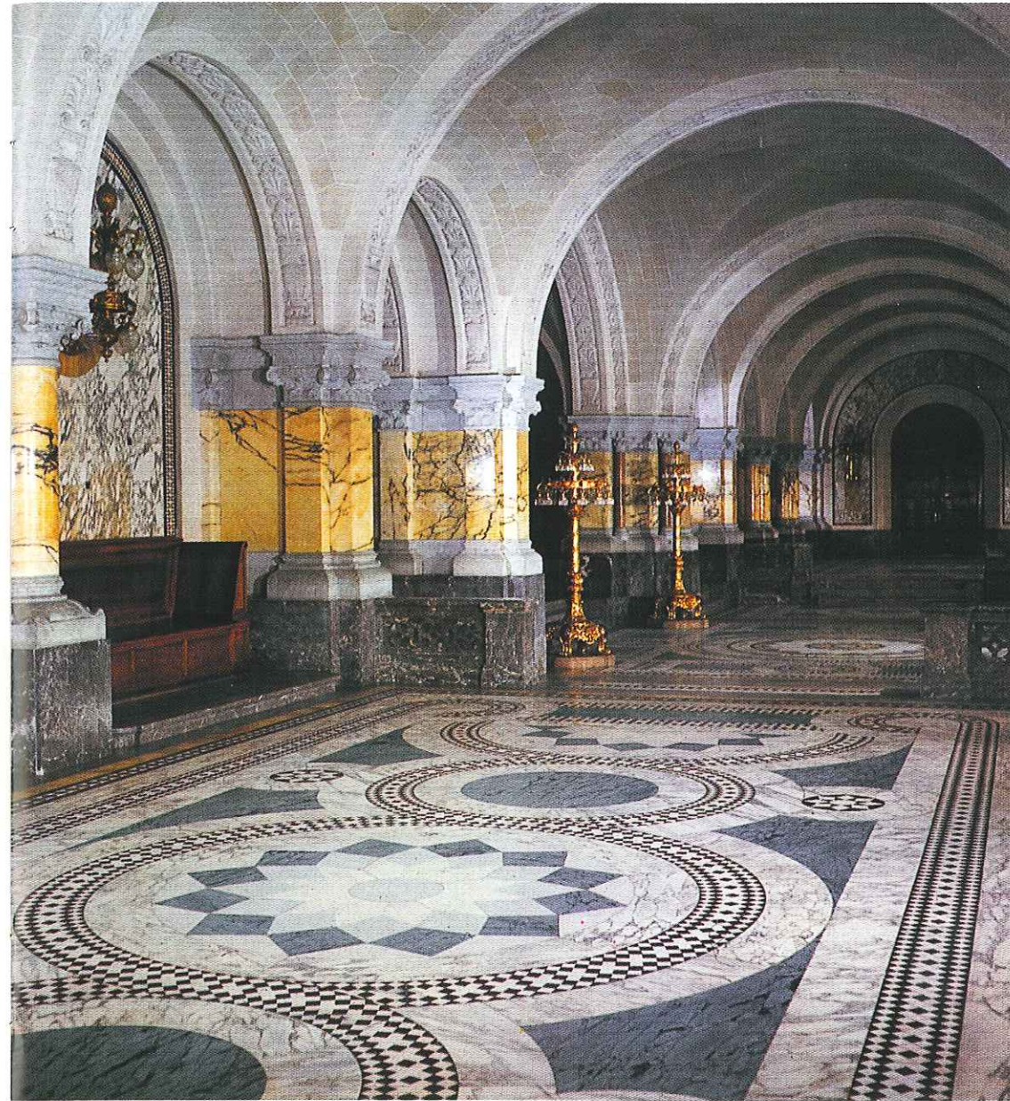
Hal / Hall / Hall / Halle

La Cour internationale de Justice siège elle aussi au Palais de la Paix. Elle a jugé depuis sa création des affaires aussi diverses: il faut mentionner notamment l'affaire entre l'Albanie et la Grande-Bretagne à propos d'incident qui s'étaient passés dans le détroit de Corfou; le litige entre la Colombie et le Pérou relative à une question de droit d'asil; le conflit pétrolier entre l'Iran et la Grande-Bretagne; l'affaire entre la France et les États-Unis relatif aux droits de citoyens américains du Maroc; le litige 'Ambatielos' opposant la Grèce et la Grande-Bretagne; et le différend Norvège-Grande-Bretagne concernant le droit de pêche dans les eaux se situant au delà de la côte norvégienne. La nouvelle Cour a rendu dix-huit avis consultatifs. Comme la précédente elle publie un Recueil de ses décisions. Comparée à la Cour permanente d'arbitrage, elle répond au souci de créer dans l'ordre international une institution plus proche des instances judiciaires telles qu'on les conçoit dans l'ordre interne.