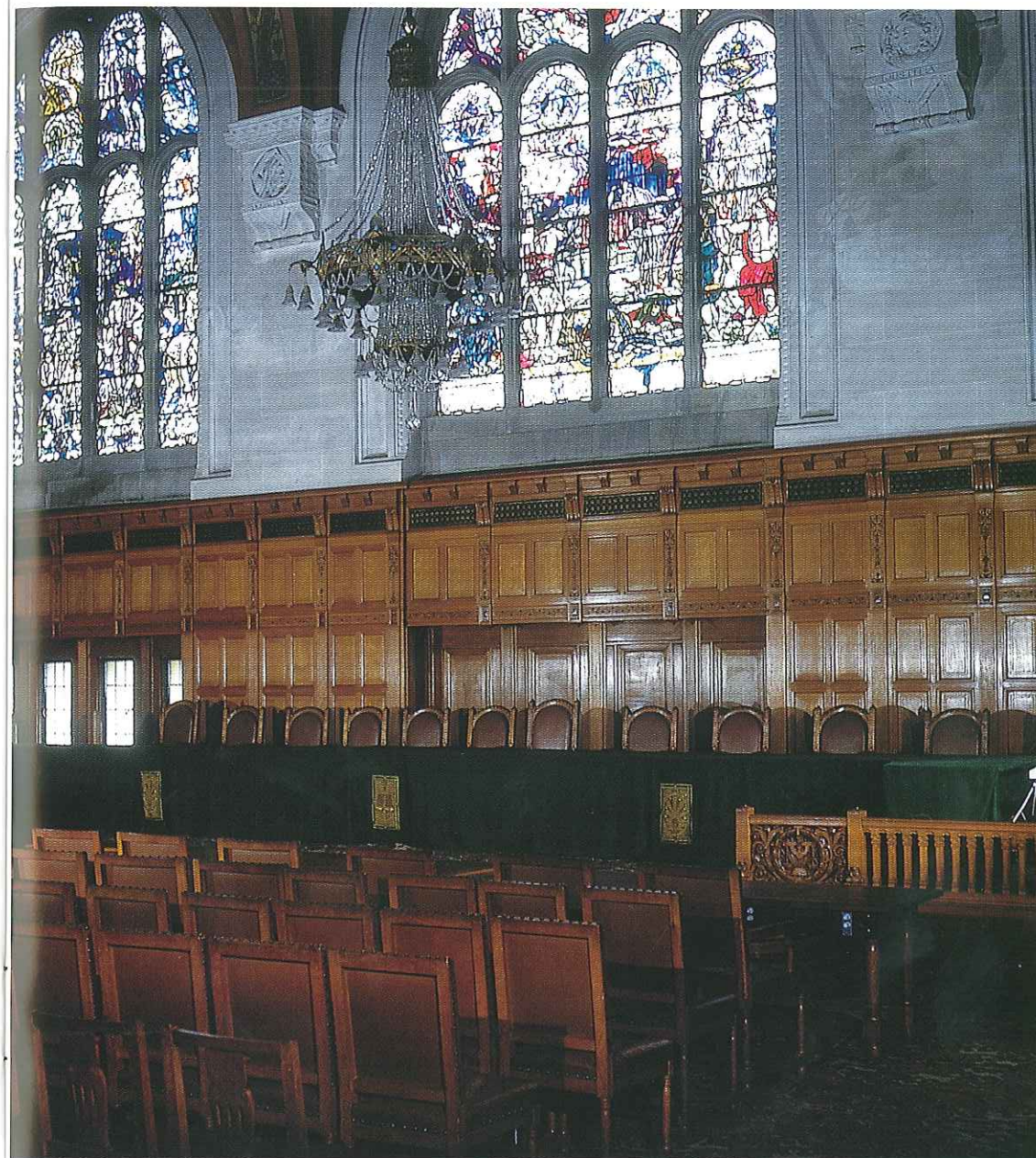
Grote zaal / Grande Salle de Justice / Great Hall of Justice / Grosser Gerichtssaal

An extensive library of international law and the law of the various nations is at the disposal of the two Courts established in the Peace Palace. One of the reasons why Carnegie presented the world with the Peace Palace was that this library would be housed in it. Like the whole palace, it is administered by the governors of the Carnegie Foundation and is therefore not a part of the United Nations, as is sometimes incorrectly believed. Originally, the library and the book store were accommodated in the palace itself. But after the First World War, when the housing of the Permanent Court of International Justice in the Peace Palace made an extension of the palace necessary, a solution was found by moving the book store to a new building which is connected to the main building by a covered bridge leading from the reading room. The books in the library cover public and private international law, comparative law and the law and jurisprudence of every country in the world. Moreover, they deal with international political and diplomatic history and peace movements. Mention should be made of a special collection of Grotiana, i.e. the works of the Dutchman Hugo de Groot or Grotius, one of the celebrated founders of the science of international law. The library further possesses a number of manuscripts, including letters from Hugo de Groot.