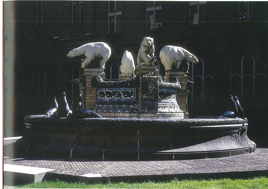
Fontein / Fontaine / Fountain / Springbrunnen

Von Zar Nikolaus II von Russland ging gegen Ende des 19. Jahrhunderts die Invitative aus, die Mächte zu einer Konferenz einzuladen, die die Frage der internationalen Schiedsgerichtsbarkeit auf die Tagesordnung stellen sollte. An dieser Konferenz, die 1899 im Haag abgehalten wurde und die als Erste Haager Friedenskonferenz bekannt geworden ist nahmen 26 Staaten teil. Man beschloss die Gründung eines ständigen Schiedsgerichtshofes im Haag, um den Staaten den Weg zu einer schiedsrichterlichen Entscheidung ihrer Streitigkeiten zu ebeneden. Die zweite Haager Friedenskonferenz wurde im Jahre 1907 abgehalten. Der Ständige Schiedshof, so wie er als Ergebnis der beiden Friedenskonferenzen entstanden ist, ist kein Gericht im üblichen Sinne des Wortes. Weder ist er ständig in Funktion noch verfügt er über festangestellte Richter. Der Hof setzt sich aus zahlreichen