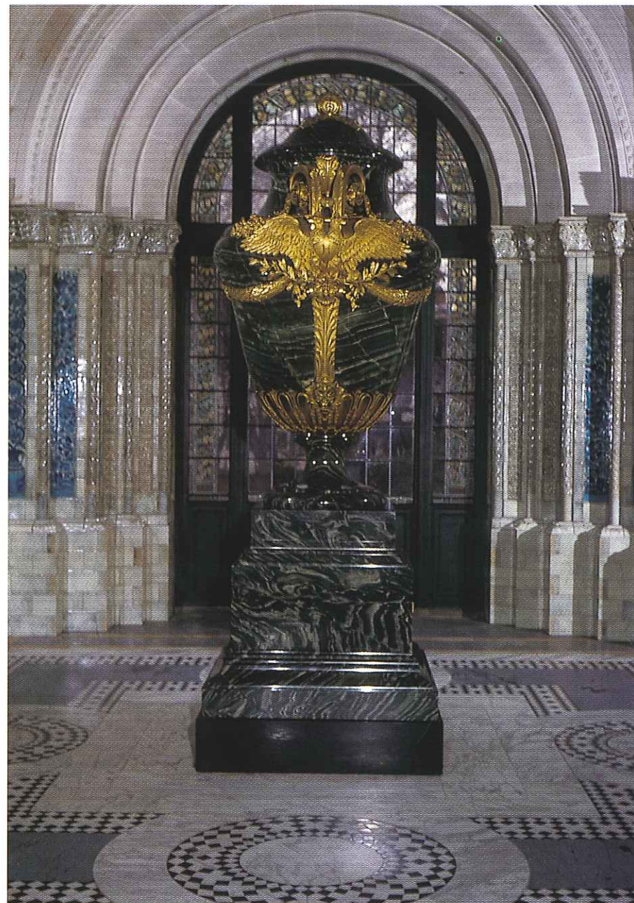
Jaspisvaas / Vase en jaspe / Jaspenvase / Jaspisvase

The inauguration ceremony was held on 28 August 1913. Among those present were Queen Wilhelmina and Andrew Carnegie.