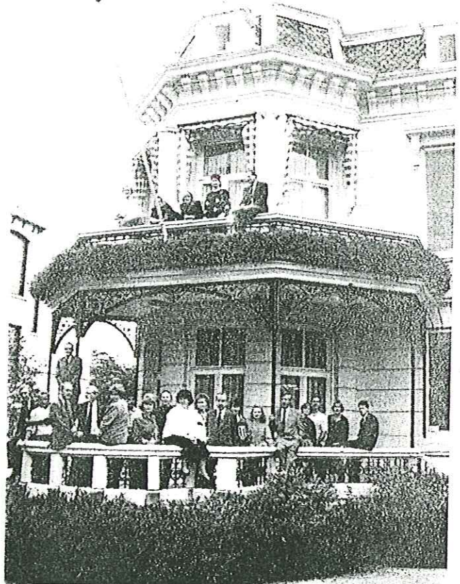
De Maatschap Brabers & Partners met alle personeelsleden