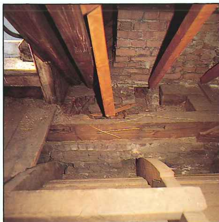
Ernstige houtrot tast de dakconstructie aan