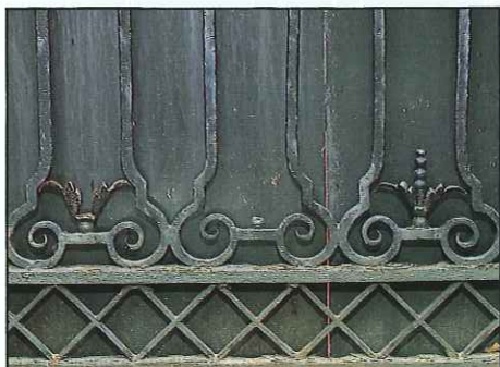
Roestvorming tast zelfs al de symmetrie van het monumentale toegangshek aan

Ondanks de zwaarwegende eigen verantwoordelijkheden van de Liberaal-Joodse Gemeente, doet ze tevens een beroep op een ieder die het belang inziet van het instandhouden van een monumentaal gebouw, van een unieke synagoge, van een bijzonder plekje Den Haag. Een gebouw dat de basis is voor het voortbestaan van de thans bloeiende gemeente.