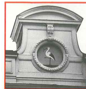
Nr. 26 vormt het hoogtepunt in de harmonische huizenrij aan de Javastraat

De Javastraat 26 vormt het hoogtepunt in de harmonische huizenrij, die in de jaren na 1862 aan de noordzijde (de kant van de zee) is gebouwd. Deze gevelrij geeft een monumentale afsluiting aan de 19-eeuwse stadsaanleg van het Plein 1813 en omgeving, die als één van de fraaiste stedenbouwkundige complexen in ons land uit de 19e eeuw wordt beschouwd.