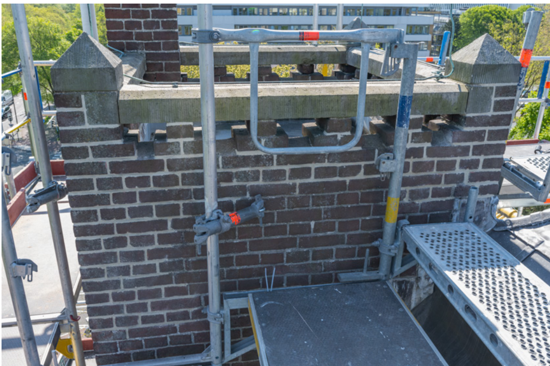
Afbeelding 10 (hersteld voegwerk torentje)