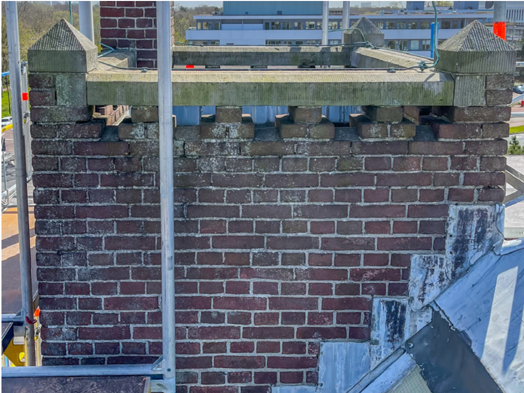
Afbeelding 9 (beschadigd voegwerk torentje)