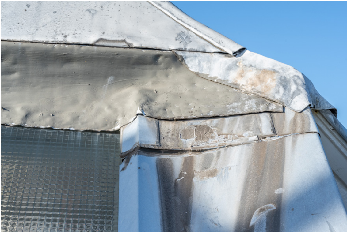
Afbeelding 7 (oud)

Kantoorgebouw Scheveningseweg 42 Den Haag