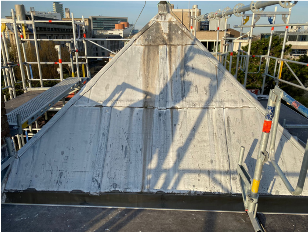
Afbeelding 3 (oud)

Kantoorgebouw Scheveningseweg 42 Den Haag