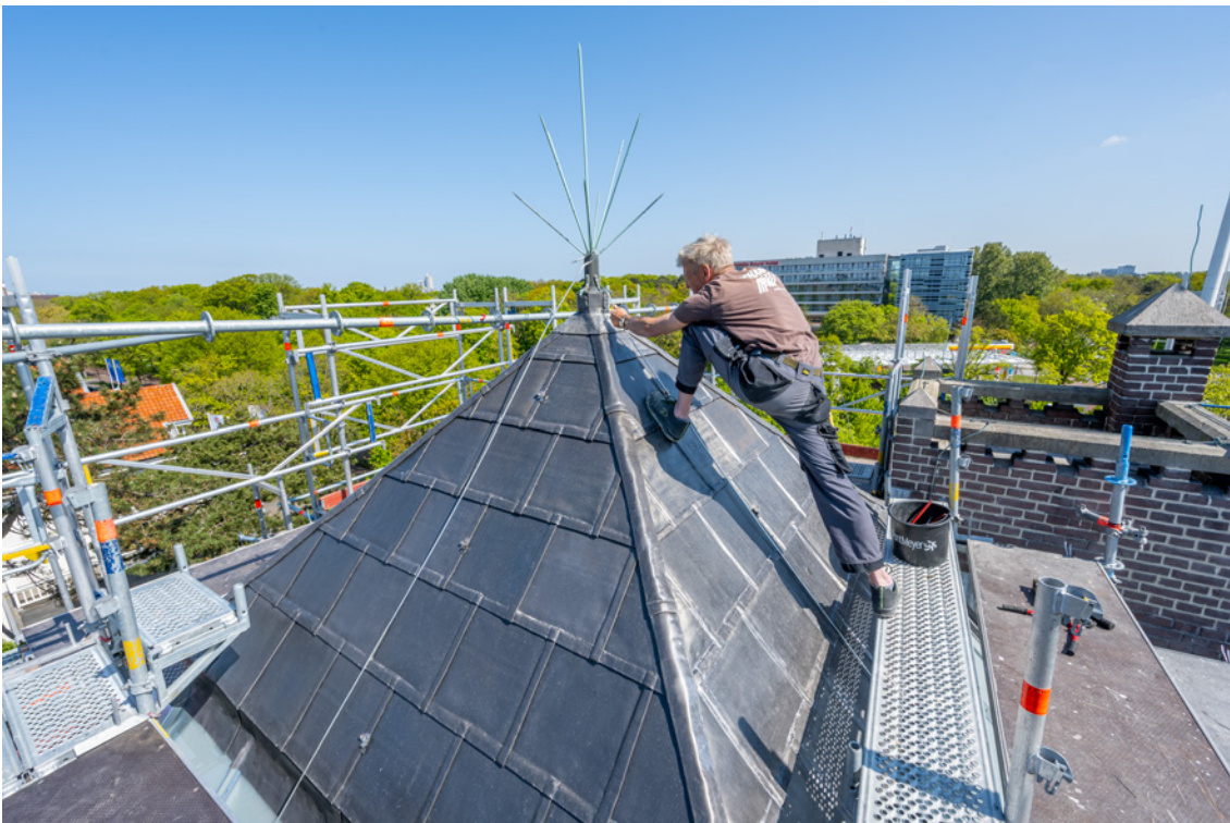
Afbeelding 12 (Herstel bliksem afleiding en hersteld voegwerk torentje)