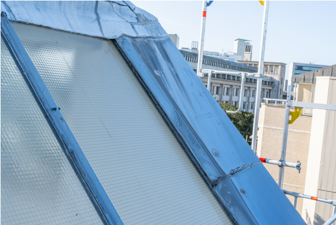
Afbeelding 5 (oud)

Kantoorgebouw Scheveningseweg 42 Den Haag