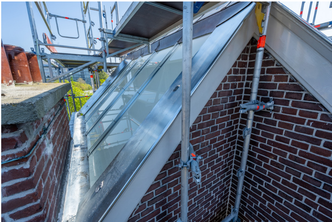
Afbeelding 8 (nieuw)