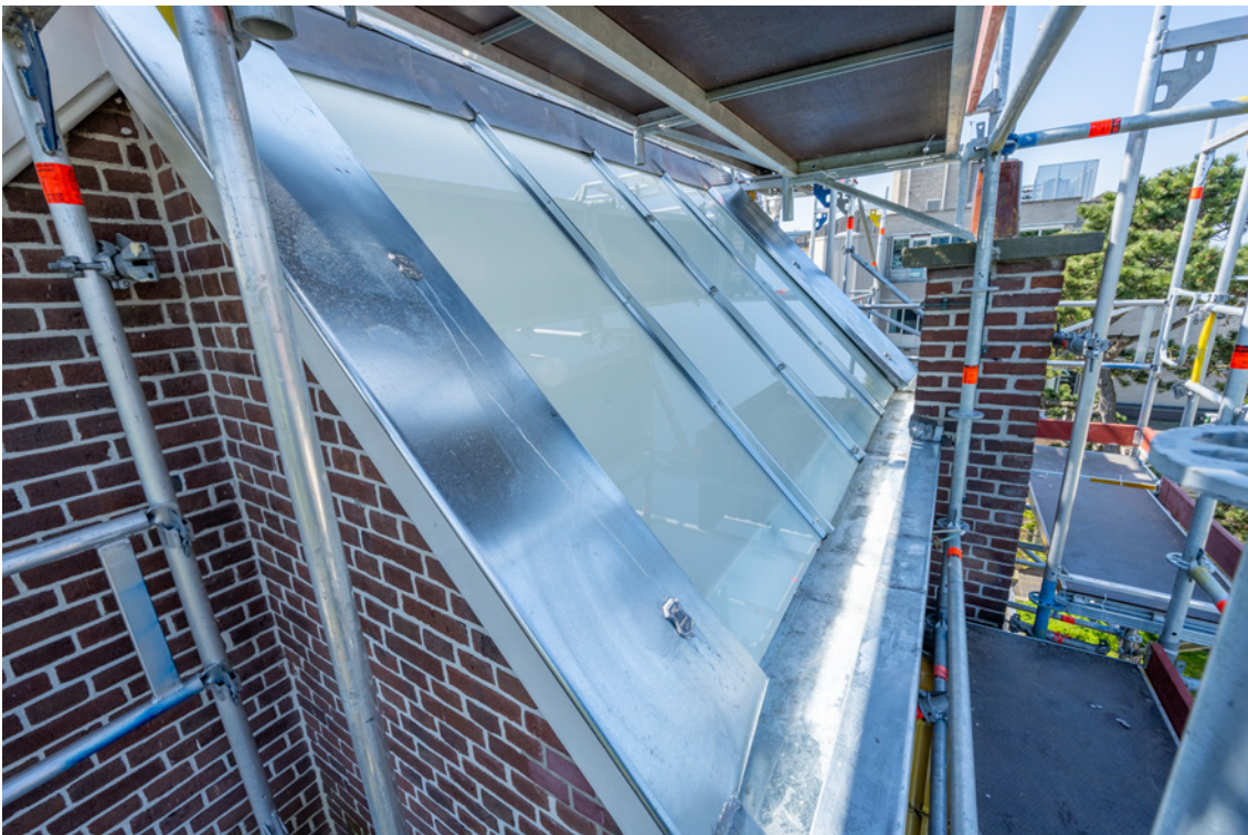
Afbeelding 6 (nieuw)