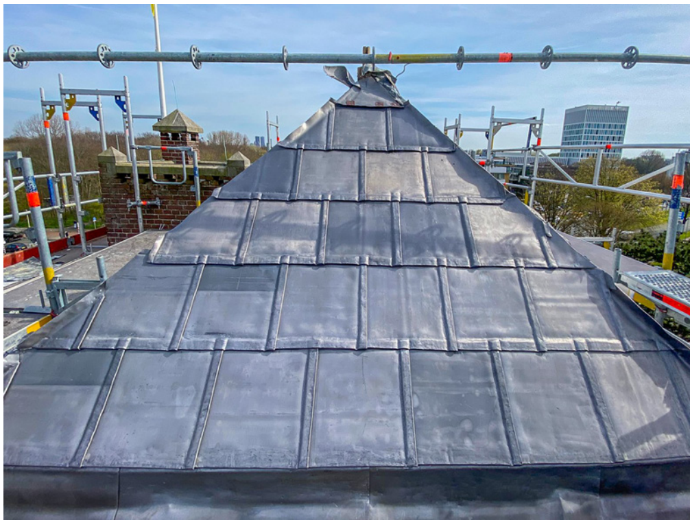
Afbeelding 4 (nieuw)