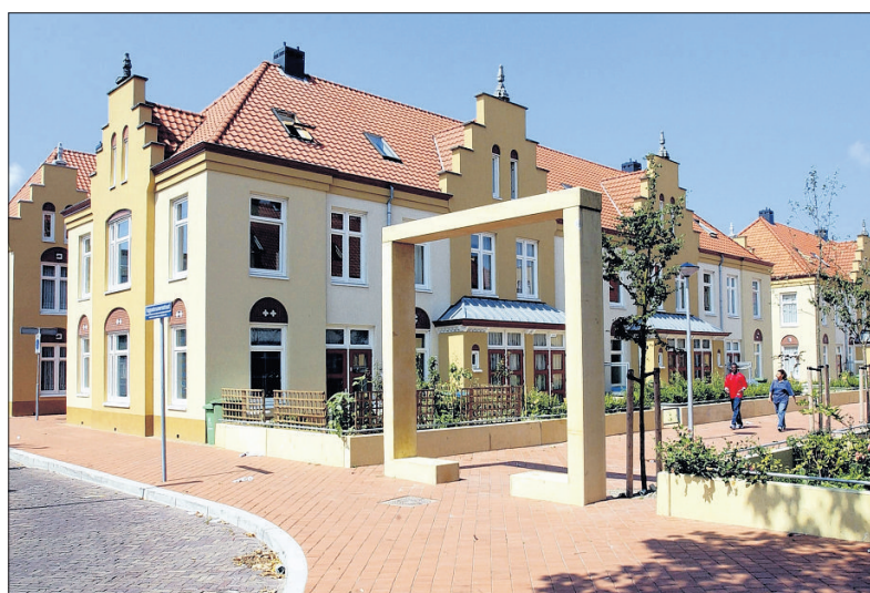
Het Fort in de Schilderswijk na de renovatie in 2001, waarbij het oorspronkelijke karakter deels verloren ging.