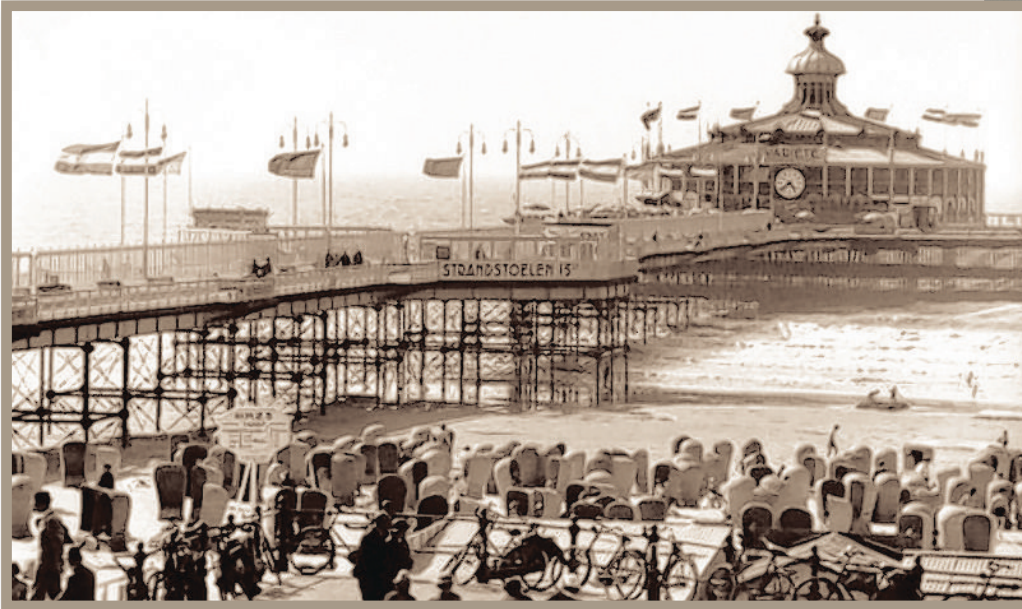
De Oude Pier omstreeks 1930, deels afgebrand in 1943 en daarna gesloopt.

vaardigheid van Van Liefland; hij kon mooie gevels maken in allerlei stijlen, maar was ook een begaafd constructeur.